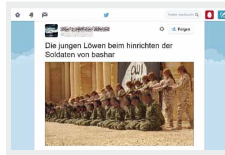
Kinder werden von Dschihadisten als Henker in Szene gesetzt.

Darüber hinaus inszenieren sich dschihadistische Gruppen auch als Beschützer und Versorger. Bilder und Videos im Netz zeigen Anhänger des IS beim Verteilen von Süßigkeiten, Spielsachen, Kleidung und Nahrungsmitteln an Kinder in den von ihnen besetzten Gebieten. Vermittelt wird die Botschaft, der Islamische Staat gewährleiste Sicherheit und Sorge sich um das Wohlbefinden der Kleinen. Auch deutsche Islamisten sind in diesen Videos zu sehen und richten sich speziell an deutsches Publikum. Sie vermitteln die Botschaft, für die gerechte Sache lohne es sich, in den Kampf zu ziehen.